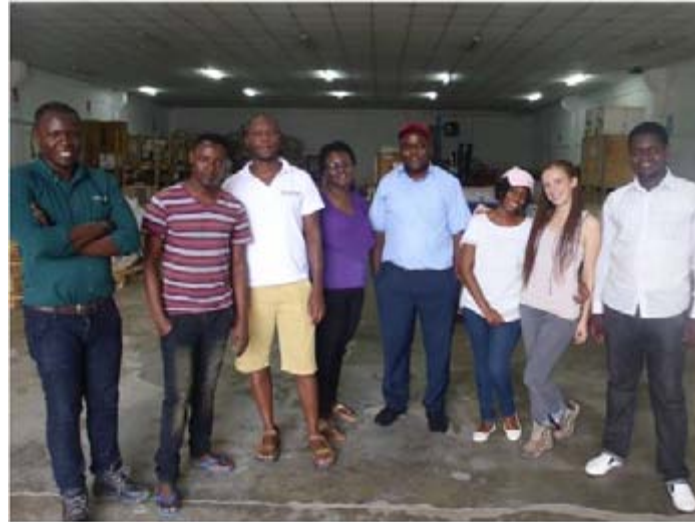
Dar es Salaam : équipe logistique

Dans chaque pays, l’ONG a souvent une équipe de coordination dans la capitale et plusieurs projets dans d’autres régions. Dans chaque endroit il y a une petite équipe d’expatriés, la majorité du personnel étant nationale. Les expatriés sont présents pour assurer la neutralité et la redevabilité de l’organisation afin de gérer l’encadrement et surtout le transfert de compétences.