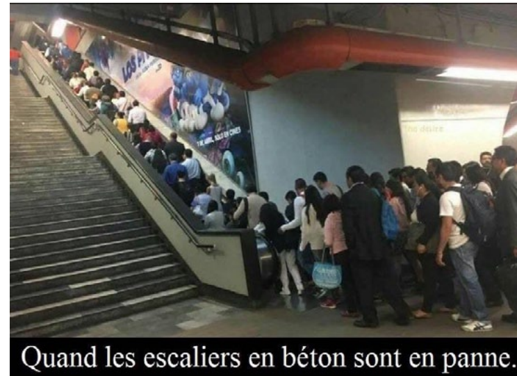
Quand les escaliers en béton sont en panne.