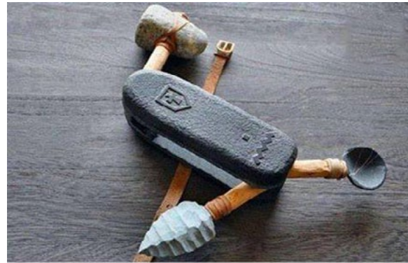
Découverte archéologique en Suisse.