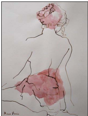
Le Fichu rose, mars 2011

Avoir fait des maths aide certainement ! Par ailleurs, dans mes études, notamment en prépa, j'ai appris la ténacité : on échoue, on recommence. Les choses ne sont pas parfaites du premier coup. En