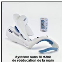
Systeme sans fil H200 de rééducation de la main

ajoutée sur le marché du travail. Un bilan de compétences peut s'avérer très positif. Ensuite, cela n'engage que moi, il faut rester pragmatique, laisser de côté les fichiers PowerPoint et Excel et faire appel à son bon sens, savoir écouter, être curieux,